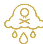
RIZIKO KONTAMINÁCIE VODOJEMOV PRI DAŽDOCH